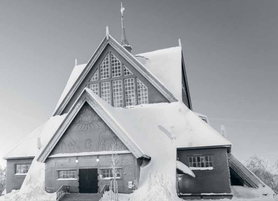
Kiruna kyrka, Kiruna.

• Positiv målgrupp ○ Neutral målgrupp ● Negativ målgrupp