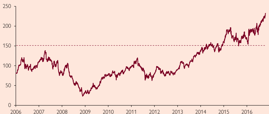
NCC AB (B-AKTIE)