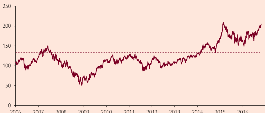
SKANSKA AB (B-AKTIE)