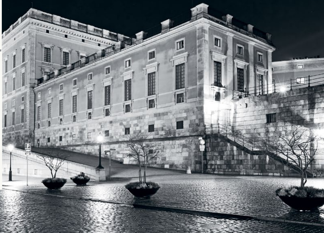
Stockholms Slott, Stockholm

• Positiv målgrupp ○ Neutral målgrupp ● Negativ målgrupp